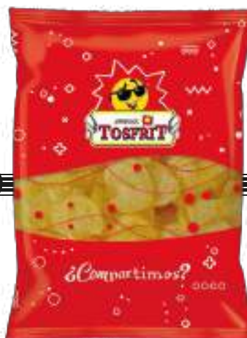
PATATAS FRITAS AL PUNTO DE SAL / SALTED POTATO CHIPS 500 gr

CÓDIGO ARANCELARIO / TARIFF CODE: 2005.20.20.00 CÓD. BOLSA/BAG CODE: 8422114018030 CÓD. CAJA/BOX CODE: 18422114018037 UDS POR CAJA/UNITS PER BOX: 6 CAJAS POR PALET/BOXES PER PALLET: 24