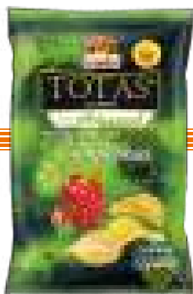
PATATAS FRITAS SABOR CAMPESINAS / COUNTRY RECIPE FLAVOURED POTATO CHIPS 85 gr CÓDIGO ARANCELARIO / TARIFF CODE: 2005.20.20.00 CÓD. BOLSA/BAG CODE: 8422114171964 CÓD. CAJA/BOX CODE: 18422114171961 UDS POR CAJA/UNITS PER BOX: 10 CAJAS POR PALET/BOXES PER PALLET: 64