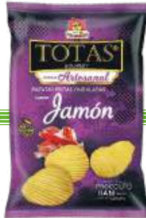
PATATAS FRITAS ONDULADAS SABOR JAMÓN / HAM FLAVOURED WAVY POTATO CHIPS 45 gr CÓDIGO ARANCELARIO / TARIFF CODE: 2005.20.20.00 CÓD. BOLSA/BAG CODE: 8422114141370 CÓD. CAJA/BOX CODE: 18422114141377 UDS POR CAJA/UNITS PER BOX: 15 CAJAS POR PALET/BOXES PER PALLET: 80