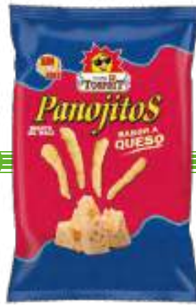
PALITOS DE MAÍZ FRITOS SABOR QUESO / FRIED CHEESE FLAVOURED CORN STICKS 60 gr CÓDIGO ARANCELARIO / TARIFF CODE: 1103.20.00.00 CÓD. BOLSA/BAG CODE: 8422114771478 CÓD. CAJA/BOX CODE: 18422114771475 UDS POR CAJA/UNITS PER BOX: 20 CAJAS POR PALET/BOXES PER PALLET: 80