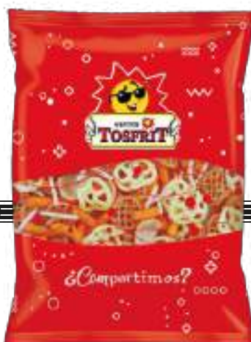
SURTIDO DE SNACKS FRITOS Y HORNEADOS / ASSORTED BAKED AND FRIED SNACKS 350 gr

CÓDIGO ARANCELARIO / TARIFF CODE: 1103.20.00.00 CÓD. BOLSA/BAG CODE: 8422114837839 CÓD. CAJA/BOX CODE: 18422114837836 UDS POR CAJA/UNITS PER BOX: 6 CAJAS POR PALET/BOXES PER PALLET: 24