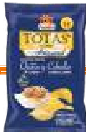
PATATAS FRITAS SABOR QUESO DE CABRA Y CEBOLLA CAMELIZA / GOAT CHEESE AND CARAMEL ONION FLAVOURED POTATO CHIPS 85 gr CÓDIGO ARANCELARIO / TARIFF CODE: 2005.20.20.00 CÓD. BOLSA/BAG CODE: 8422114151966 CÓD. CAJA/BOX CODE: 18422114151961 UDS POR CAJA/UNITS PER BOX: 10 CAJAS POR PALET/BOXES PER PALLET: 64