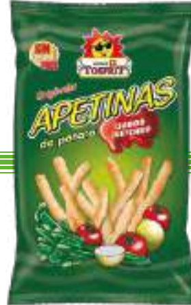
PALITOS DE PATATA FRITOS SABOR KETCHUP / FRIED KETCHUP FLAVOURED POTATO STICKS 35 gr CÓDIGO ARANCELARIO / TARIFF CODE: 1103.20.00.00 CÓD. BOLSA/BAG CODE: 8422114710972 CÓD. CAJA/BOX CODE: 18422114710979 UDS POR CAJA/UNITS PER BOX: 20 CAJAS POR PALET/BOXES PER PALLET: 80