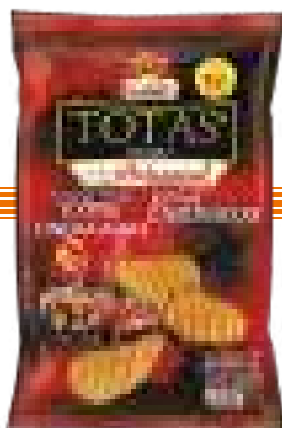
PATATAS FRITAS EXTRA ONDULADAS SABOR BARBACOA / BBQ FLAVOURED EXTRA WAVY POTATO CHIPS 85 gr CÓDIGO ARANCELARIO / TARIFF CODE: 2005.20.20.00 CÓD. BOLSA/BAG CODE: 8422114051969 CÓD. CAJA/BOX CODE: 18422114051966 UDS POR CAJA/UNITS PER BOX: 10 CAJAS POR PALET/BOXES PER PALLET: 64