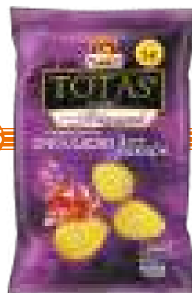
PATATAS FRITAS ONDULADAS SABOR JAMÓN / HAM FLAVOURED WAVY POTATO CHIPS 85 gr CÓDIGO ARANCELARIO / TARIFF CODE: 2005.20.20.00 CÓD. BOLSA/BAG CODE: 8422114141967 CÓD. CAJA/BOX CODE: 18422114141964 UDS POR CAJA/UNITS PER BOX: 10 CAJAS POR PALET/BOXES PER PALLET: 64