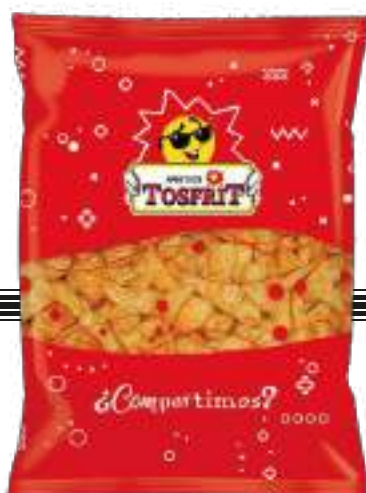
SNACKS DE MAÍZ FRITO SABOR QUESO / FRIED CHEESE FLAVOURED CORN SNACKS 650 gr

CÓDIGO ARANCELARIO / TARIFF CODE: 1005.90.20.00 CÓD. BOLSA/BAG CODE: 8422114647735 CÓD. CAJA/BOX CODE: 18422114647732 UDS POR CAJA/UNITS PER BOX: 6 CAJAS POR PALET/BOXES PER PALLET: 24