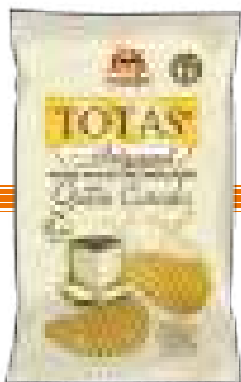
PATATAS FRITAS SABOR QUESO CURADO CURED CHEESE FLAVOUR CHIPS 85 gr CÓDIGO ARANCELARIO / TARIFF CODE: 2005.20.20.00 CÓD. BOLSA/BAG CODE: 8422114091965 CÓD. CAJA/BOX CODE: 18422114091962 UDS POR CAJA/UNITS PER BOX: 10 CAJAS POR PALET/BOXES PER PALLET: 24