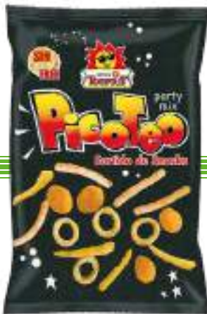
MIX DE SNACKS DE MAÍZ Y PATATA FRITOS Y HORNEADOS / ASSORTED FRIED AND BAKED POTATO AND CORN SNACKS 50 gr CÓDIGO ARANCELARIO / TARIFF CODE: 1103.20.00.00 CÓD. BOLSA/BAG CODE: 8422114731274 CÓD. CAJA/BOX CODE: 18422114731271 UDS POR CAJA/UNITS PER BOX: 20 CAJAS POR PALET/BOXES PER PALLET: 80