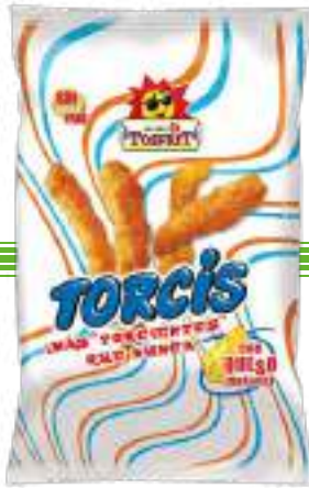
PALITOS DE MAÍZ FRITOS SABOR QUESO / FRIED CHEESE FLAVOURED CORNS STICKS 60 gr CÓDIGO ARANCELARIO / TARIFF CODE: 1103.20.00.00 CÓD. BOLSA/BAG CODE: 8422114511470 CÓD. CAJA/BOX CODE: 18422114511477 UDS POR CAJA/UNITS PER BOX: 20 CAJAS POR PALET/BOXES PER PALLET: 80