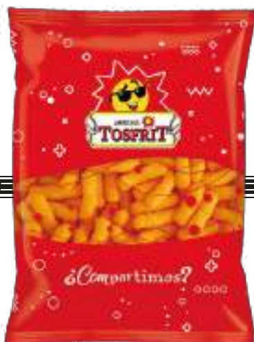
SNACKS DE MAÍZ HORNEADO SABOR QUESO / BAKED FLAVOURED CHEESE CORN SNACKS 500 gr

CÓDIGO ARANCELARIO / TARIFF CODE: 1103.20.00.00 CÓD. BOLSA/BAG CODE: 8422114318031 CÓD. CAJA/BOX CODE: 18422114318038 UDS POR CAJA/UNITS PER BOX: 6 CAJAS POR PALET/BOXES PER PALLET: 24