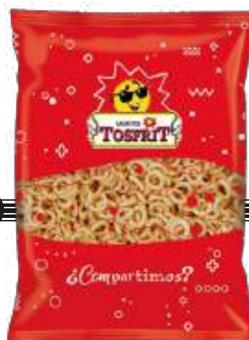
AROS DE MAÍZ FRITOS / FRIED CORN RINGS 1000 gr

CÓDIGO ARANCELARIO / TARIFF CODE: 1103.20.00.00 CÓD. BOLSA/BAG CODE: 8422114938239 CÓD. CAJA/BOX CODE: 18422114938236 UDS POR CAJA/UNITS PER BOX: 6 CAJAS POR PALET/BOXES PER PALLET: 24