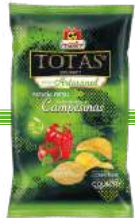
PATATAS FRITAS SABOR CAMPESINAS / COUNTRY RECIPE FLAVOURED POTATO CHIPS 45 gr CÓDIGO ARANCELARIO / TARIFF CODE: 2005.20.20.00 CÓD. BOLSA/BAG CODE: 8422114171377 CÓD. CAJA/BOX CODE: 18422114171374 UDS POR CAJA/UNITS PER BOX: 15 CAJAS POR PALET/BOXES PER PALLET: 80